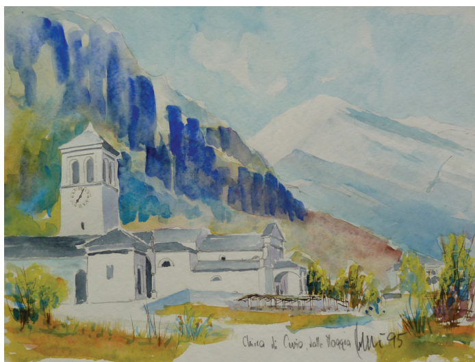
Chiesa di Cevio, Vallemaggia, 1995