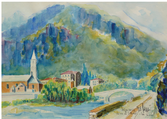
Bignasco, chiesa di S.Michele e S.Rocco, 1996