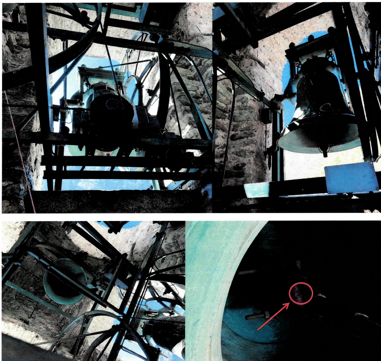
Crepa nell'elemento di fissaggio (pelle)

Di seguito alcune immagini dell'attuale impiantistica.